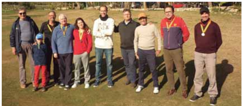
Portal del Roc